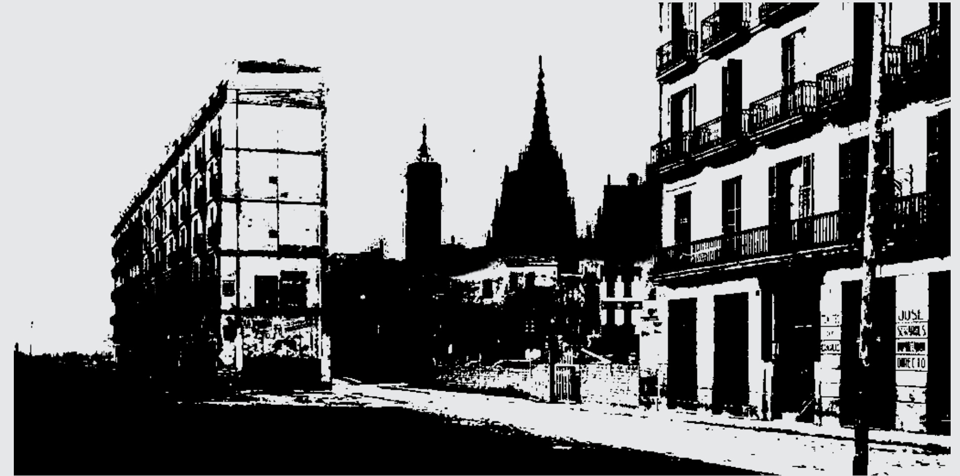
La ciutat de Barcelona buida a causa de la vaga

L'endemà la situació continuava igual, el preu del carbó i dels aliments bàsics seguia pels núvols. Les dones van tornar a concentrar-se a la tarda en el Paral·lel, al crit de “¡Abajo los acaparadores! ¡Queremos las subsistencias baratas!”. Elles preferien que les dones fossin les protagonistes de les manifestacions, perquè